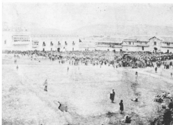
Figura 5 La plaza mayor a mediados de S. XIX

A fines del siglo XIX, según la Memoria realizada por la Sociedad de Obras Públicas, éste lugar se encontraba en total descuido. La Sociedad de Obras públicas fue la que convirtió ese paraje descuidado en una plaza que sería punto de encuentro de la sociedad chuquisaqueña, mismo que ofreciera solaz y recreo, llenado el lugar de árboles y proporcionando bancas. (Ponce, 1891:3 - 5).