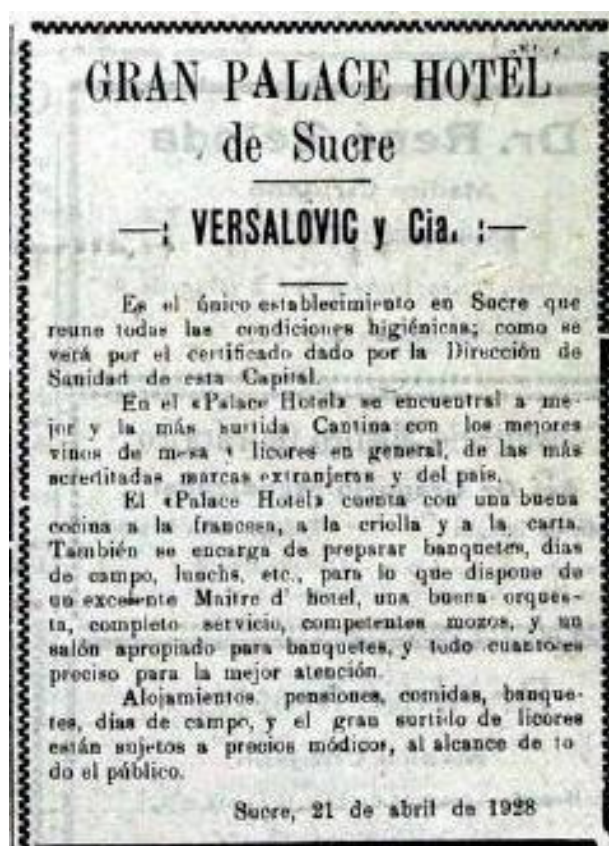
Figura 5.5. Propaganda del Gran Palace Hotel