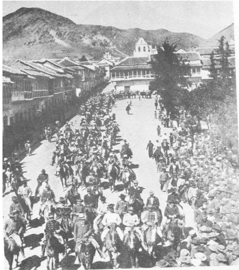
Figura 5.1 Desfile militar

La lógica del ceremonial, cambio según el periodo histórico en que se vivía. En la imagen anterior, vemos un desfile militar, de los muchos que se han realizado a lo largo de la historia de la ciudad de Sucre, teniendo como epicentro la Plaza Mayor de la ciudad. Estas y otras formas de manifestación cívica militar se han realizado en la plaza con un despliegue ceremonial, que valdría la pena estudiar. Tomaremos ahora la reflexión de Georges Balandier (1994), cuando afirma que: “Estado personifica el poder, la fiesta constituye la oportunidad para que la sociedad se muestre «idealmente» en el plano espectacular. El desfile, la procesión militar y civil, son las expresiones ceremoniales del dogma y de la pedagogía de los gobernantes.” (Balandier, 1994: 21)