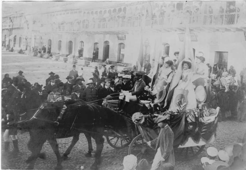
Figura 5.4 Entrada de carrozas

El espacio evoca momentos pasados, y estos se insertan en el imaginario de la sociedad, constituyendo arquetipos de un conjunto de personas que comparten espacio y tiempo en un momento de la historia.