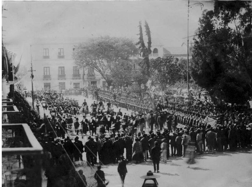
Figura 5.2 Desfile cívico-militar

En el desfile cívico-militar se extienden una serie de protocolos y suntuosidad que realzan el momento. Es éste tipo de despliegue teatral que carga de un valor adicional al espacio en el que se desarrolla una determinada actividad. Para Georges Balandier, “El desfile es el instrumento que le permite a la sociedad urbana darse a ver, exhibirse espectacularmente. (Balandier, 1994: 99) marcando una diferencia entre el grupo social que participa del ceremonial y aquel que observa. En el mismo el convencionalismo juega un papel importante en el desarrollo del ceremonial, se debe proceder de una manera precisa, por ejemplo las autoridades principales encabezan el desfile seguido de aquellas personas o instituciones en grado de importancia, manteniendo un orden que no altere el sentido de la demostración (Balandier, 1994: 134)