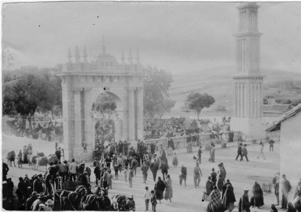
Figura 5.5 Parque Centenario